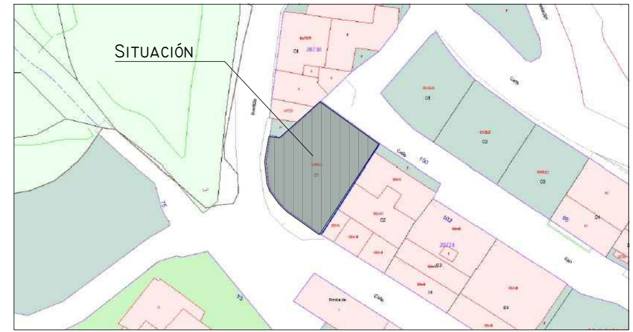
SITUACIÓN RESPECTO AL CATASTRO